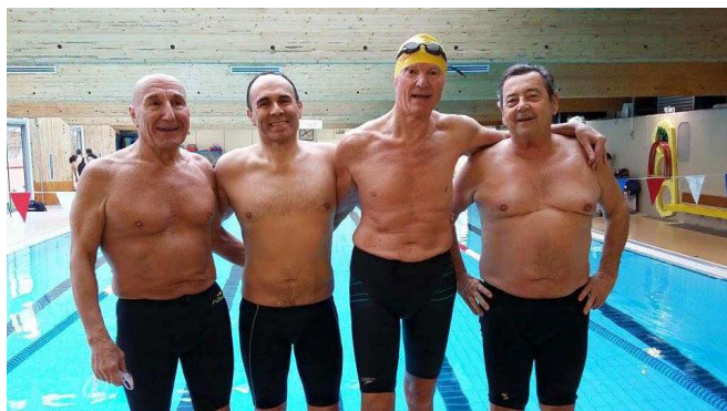
© Bruno Faure et Éric Dupuy