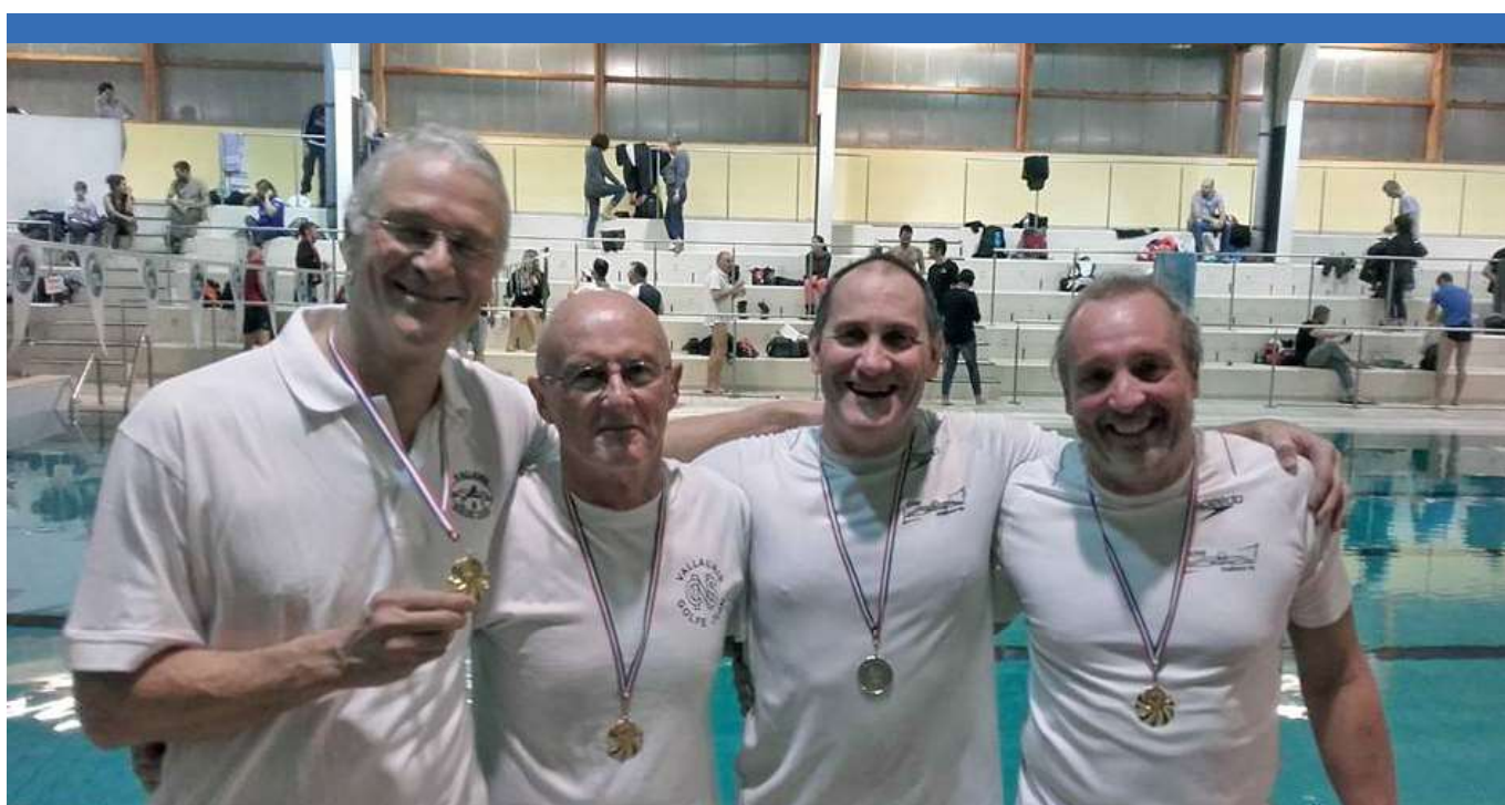
Relais R5 du CNS Vallauris.