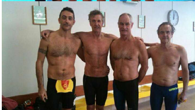
© Bruno Faure et Éric Dupuy