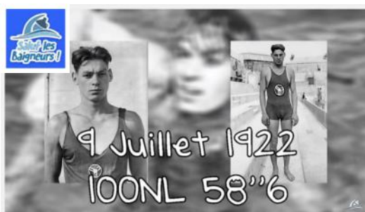
Johnny "Tarzan" Weissmüller - Salut les Baigneurs #8

Comme Bud, Johnny passera des bassins à l'écran en incarnant l'un des rôles des plus célèbres : le fameux Tarzan. Pour en savoir plus, là encore, prenez quelques minutes pour visionner la vidéo d'Antoine.