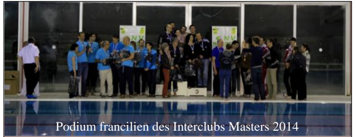
Podium francilien des Interclubs Masters 2014